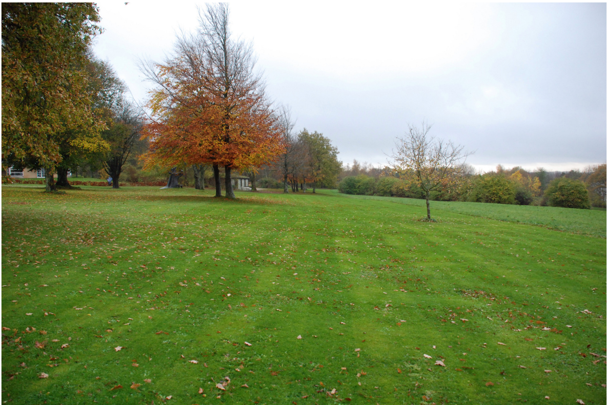
Indløb til mål området (set fra målportalen)