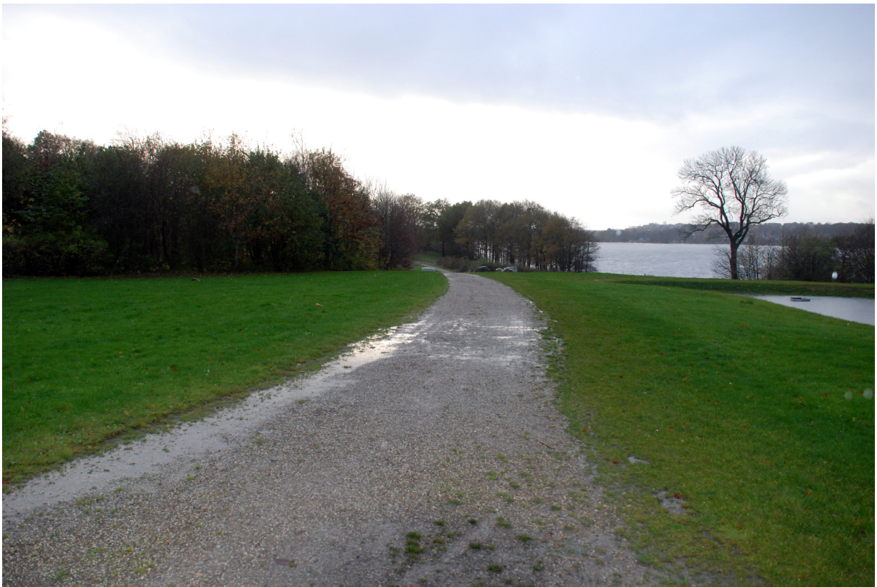
Grusbelagt sti ude på ruten i Nordisk Park med Sønderø i baggrunden