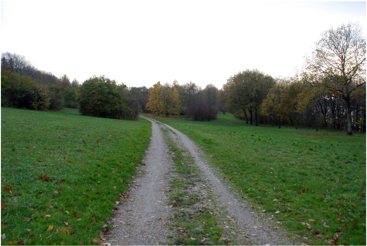
Grusbelagt sti på ruten som fører op mod Forstbotanisk Have